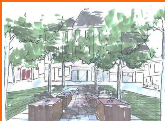
PLACE DU COMMERCE