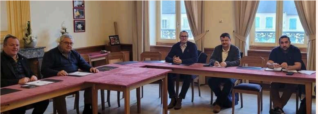
Réunion entre le Maire de Sancoins et le Président du SDE 18 à sa droite, ainsi que des personnels du syndicat.

Pour réaliser ces opérations la ville s'appuie sur le syndicat départemental d'énergie du Cher (SDE 18), à qui elle a délégué la compétence pour la gestion et la maintenance de son éclairage public. Le SDE 18 accompagne les communes dans la transition énergétique. Il intervient sur le réseau électrique par le diagnostic, le conseil, dans la conduite des travaux mais aussi dans l'accompagnement et dans la recherche des aides financières.