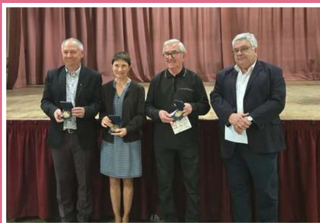
REMISE DES MEDAILLES DE LA VILLE