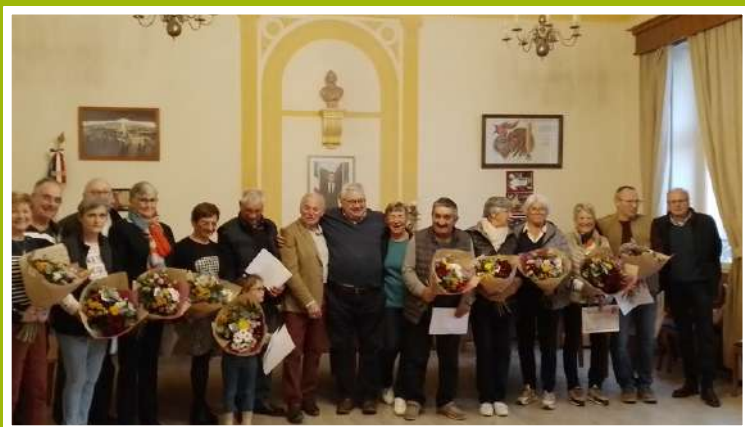
CÉRÉMONIE DES VILLES ET VILLAGES FLEURIS