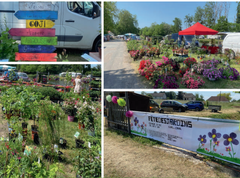
LA FÊTE DES JARDINS