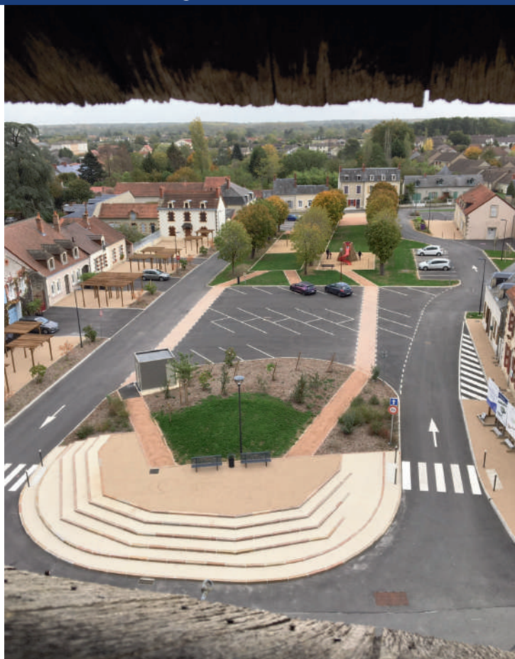
PLACE DU CHAMP DE FOIRE VUE DE L'EGLISE