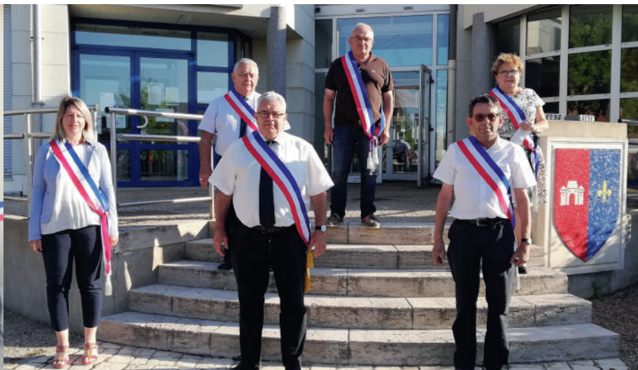
MONSIEUR LE MAIRE ET SES ADJOINTS